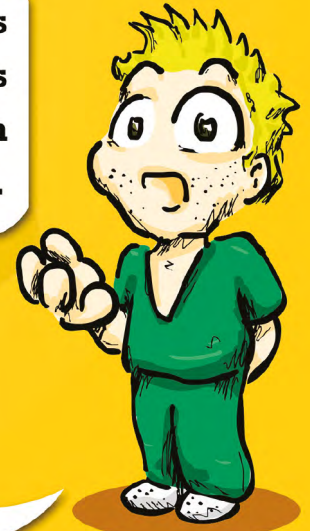
Residente de Inmunología

Para los que escogen la Especialidad de Inmunología , la SEI es la única asociación que defiende nuestros intereses y lucha para que se cree el ÁREA DE CAPACITACIÓN ESPECÍFICA y que nuestra especialidad tenga FUTURO .